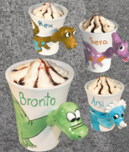
Dino's Vanille mit Schokoladensauce Tässchen zum Sammeln Fr. 6.00