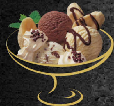
Rock'n'Roll Vanille-, Chocolat- und Stracciatellaglace mit Rahm Fr. 10.50