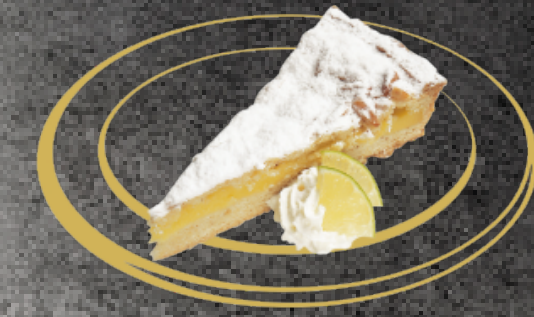
Torta della Nonna Fr. 6.50