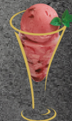
Zwetschge Sorbet Zwetschge mit Vieille Prune Fr. 12.50