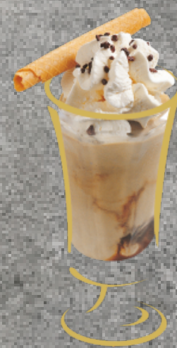
Café Glace Moccaglace mit Rahm Fr. 10.50