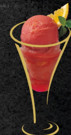
Blutorange Sorbet Blutorange mit Campari Fr. 12.50