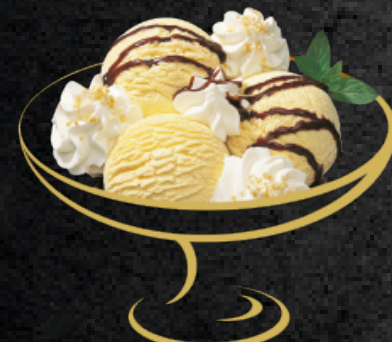
Danemark Vanilleglace mit Schokoladensauce und Rahm Fr. 10.50