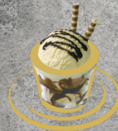
Mini Danmark Vanilleglace mit Schokoladensauce Fr. 5.00