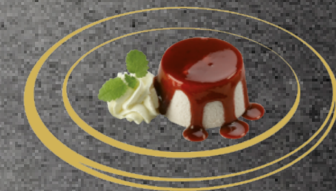
Panna Cotta mit warmen Beeren Fr. 8.00