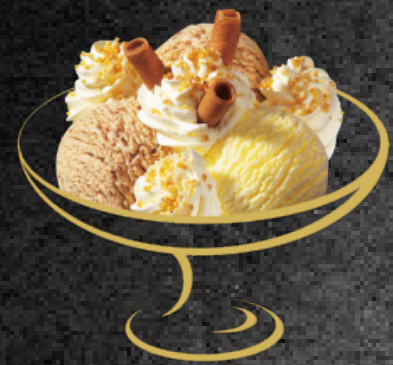
Coupe Nusstorte Vanille- und Nusstortenglace mit Rahm Fr. 10.50