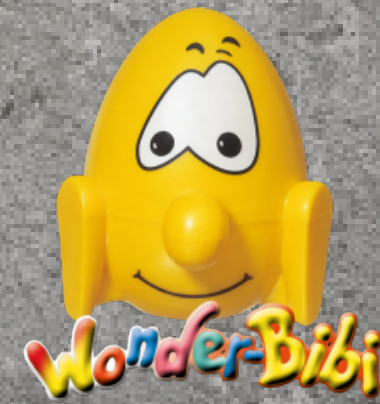
Wonderbibi Stracciatella mit Überraschung Fr. 6.00