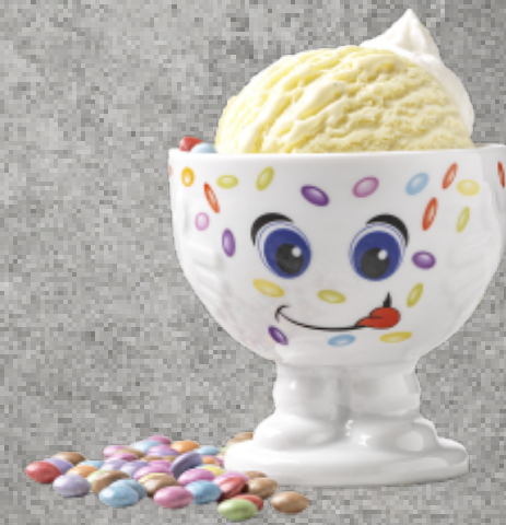
Coupe & Spiel 1 Kugel Glace nach Wahl, bunte Smarties und ein Spiel zum mitnehmen Fr. 6.50