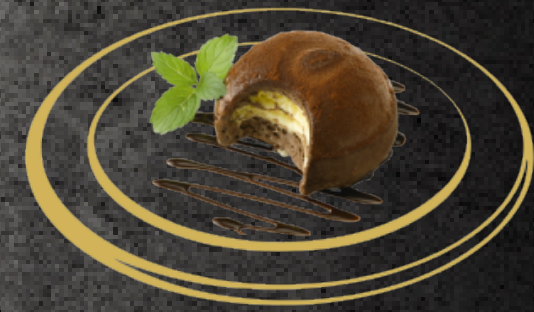
Tartufo Cioccolato Chocolat - Sabayon Rahmglace mit Kakao gepudert Fr. 6.00