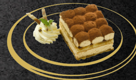
Tiramisù Hausgemacht Fr. 9.00