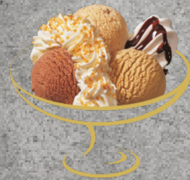
Japonais Mocca-, Chocolat- und Baumnussglace mit Rahm Fr. 10.50