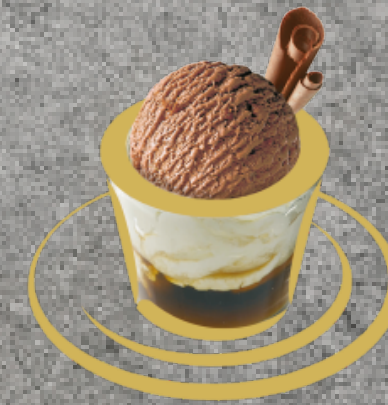
Chocolat Chocolatglace Fr. 5.00