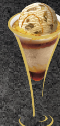
Nussknacker Nusstorte mit Baileys Fr. 12.50