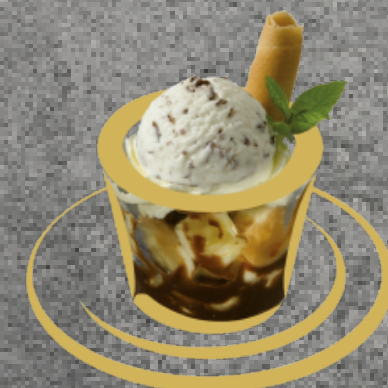
Stracciatella Stracciatellaglace Fr. 5.00