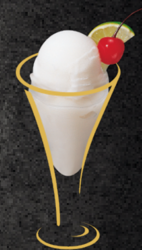
Le Colonel Sorbet Citron mit Wodka Fr. 12.50