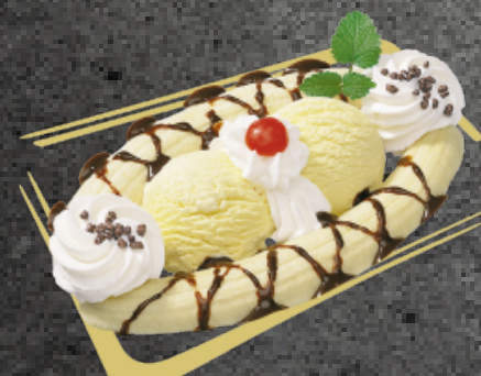
Banana Split Vanilleglace mit einer Banane, Schokoladensauce und Rahm Fr. 10.50