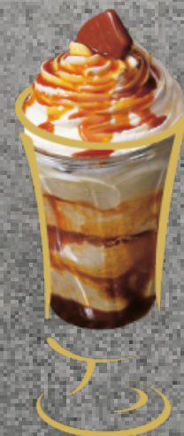
Dulcinea Vanilleglace mit Caramelsauce und Rahm Fr. 10.50