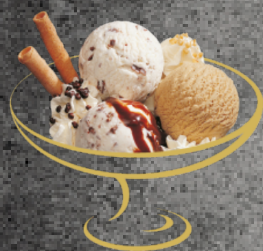
Stracciatella Stracciatella- und Moccaglace mit Rahm Fr. 10.50