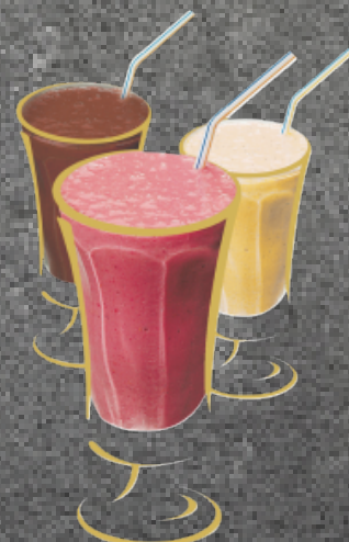
Frappé Aromen nach Wahl Fr. 8.50